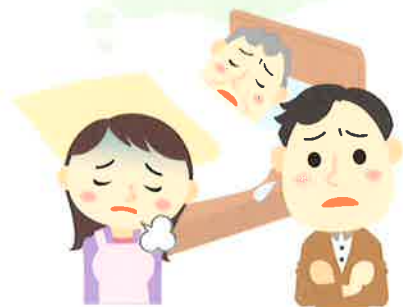
介護している家族