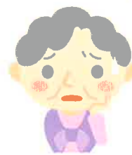
ひとり暮らしの高齢者