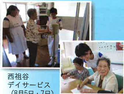
西祖谷 デイサービス (8月5日・7日)