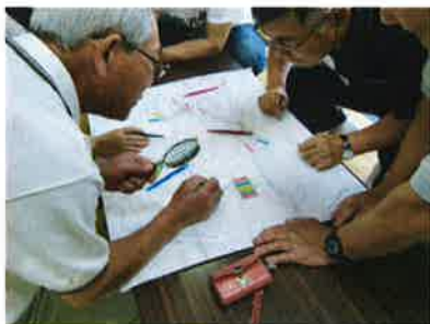
自治会ごとに作成している 大和川地区住協 【大和川若山・白地大和川自治会】