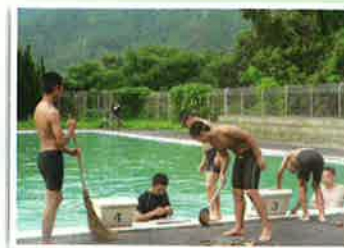
三野フェスタ 打ち上げ花火後の 清掃 (8月14日)