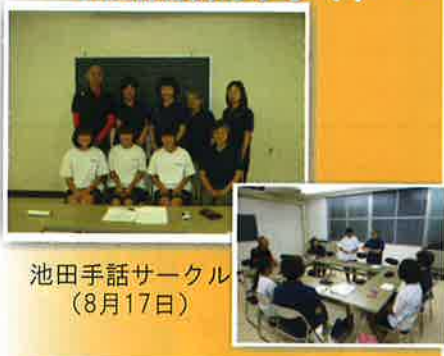
池田手話サークル (8月17日)