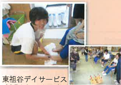
東祖谷デイサービス (8月18日・19日)