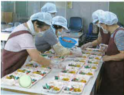
ひとり暮らし高齢者配食サービスのお弁当を作成する様子【山城やまびこ会(山城)】

また、地域の方や協力機関・団体の方が普段の関わりの中で、見守りを行い、連携し合える関係づくりが必要とされています。婦人会や民生委員・児童委員、商店会、新聞販売店、電力会社、水道検針員、ガス販売店、学校ボランティア、介護保険サービス事業者、警察などが協力して取り組みを進めています。