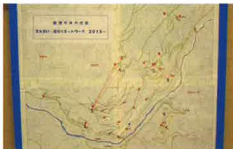
積極的に意見を出し合い 作成した「支え合いマップ」 【善徳やすらぎ会(西祖谷)】