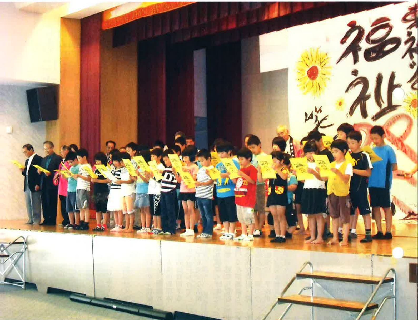
東祖谷福祉まつり