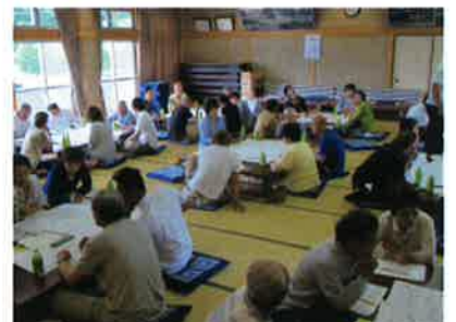
地域ごとに班分けをして 作業をすすめている様子 【佐野地区住協(池田)】

個人情報保護の適切な共有は、見守りネットワークを有効に機能させる上で最も重要な要件です。しかし、見守りの現場では、個人情報保護を理由に関係者に提供されず、「支援の壁」となっている場合もあります。しかし、防犯、交通事故防止、災害時避難など、住民の関心事にもとづくネットワーク会議やマップづくりなどの活動が「ゆるやかな見守り」の中身であり、あくまでも住民同士のふれあいや地域生活に根差した関係性を活かした見守り活動と言えます。個人情報保護の重要性を十分に認識し、保護一辺倒ではなく、効果的に活用されています。