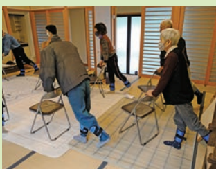
みんなで楽しくストレッチ

コロナ禍で集まりの場が少なくなった時期ではありますが、定期的な体操の機会を通じてこれまでの地域の方とのつながりを大切にしながら、住み慣れた地域での生活を続けてほしいと願っています。