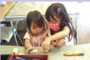
上手にできるかな？

子ども食堂やいきいき百歳体操以外の日でも気軽に立ち寄って、わいわいとおしゃべりを楽しめるようなみんなの居場所になれるようにと、いろいろな活動に取り組んでいます。