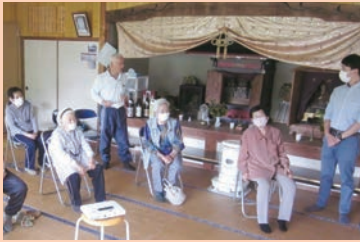
気になることはしっかり質問