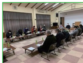
ネットワーク会議並びに地域福祉活動計画評価会議