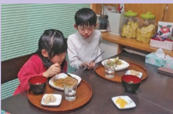
栄養いっぱいの食事ですくすく育ってね