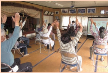
さあ～皆でやってみよう!!

参加者からは、「楽しかった」「健康のためにも続けたい」と前向きな意見があり、月二回から始めることとなりました。単なる運動の場ではなく、交流や近況確認、情報交換などを通して、地域の絆が深まり、体だけでなく地域を元気にできるサロンづくりを目指しています。