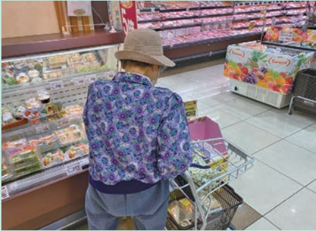
どれにしようかなあ？

利用については、車に乗れない、買物に困っている八十歳以上の方を対象に月一回の実施として、最大八名まで申込みができます。ガソリン代として、五百円負担で、家まで送迎を基本としています。今後は、買物だけではなく、昼食をみんなで食べる事なども計画しています。参加者からのご意見やご要望にも柔軟に対応したいと考えていますので、ぜひ一度、利用してみませんか？興味のある方は、社協三野支所までご連絡をお待ちしています。