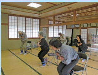
重りをつけての100歳体操

また、「いきいき100歳体操」にも熱心に取り組んでおり、今年で4年目を迎えます。毎回の参加者を記録し、年度末には「出席順位ランキング」を発表、上位者には賞品を贈呈することで、参加意欲の向上に努めています。昨年度は、コロナ禍で100歳体操を中断した時期もありましたが、年間で37回開催することができ、この取り組みのおかげで、たくさんの方が参加がありました。