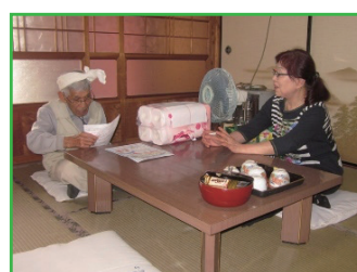
見守り訪問事業(井川支所)