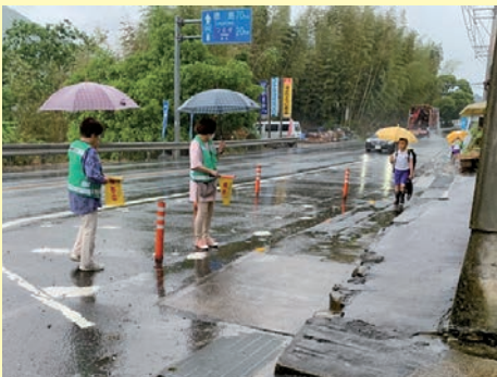
雨にも負けず！ 地域の宝を見守る「下校ボランティア」

これからも、子ども達とふれあい、楽しみながら、長くこの活動を続けていってほしいものです。