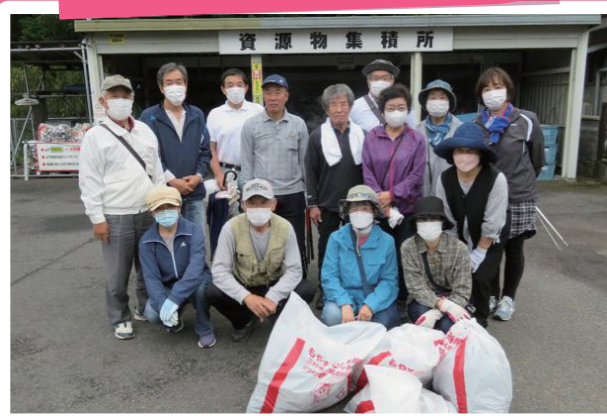
池田地区住民福祉協議会1区～4区(池田)

5月30日、日頃の運動不足の解消と美化活動を兼ねて14名が参加し、ウォーキングをしながらゴミ拾い運動を行いました。1区から4区それぞれの区内で活動をスタートし、住民同士の交流を図りながらゴールの市役所環境課をめざしました。すべての参加者がゴールに集まると、にぎやかな話し声が聞かれるなど、顔なじみの輪が広がる機会となりました。