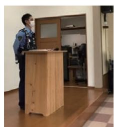
なでしこ地区住民 福祉協議会(井川)

ティーコンサート」が開催され、その収益金は、地域活動活性化を目的に消防団並びに立石・井内・かいな地区住協にご寄付されました。