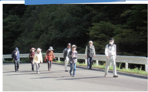
河内地区住民福祉協議会(山城)

「コロナの影響で、地域交流の機会が激減している。このままでは、コロナが収まったとしても、地域での活動ができなくなってしまう。」との危機感から、河内地区では、コロナ禍でもできる活動を検討し、屋外での事業を実施しています。