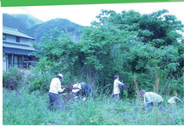
清水ささえ隊(三野)

地域の方の困りごと解決のお手伝いを目的に清水ささえ隊は平成31年に発足し活動をしています。5月20日は隊員4名で個人宅の樹木の撤去を行いました。隊員たちは依頼者の喜びの声を聞くことで、喜びとやりがいを感じ、お互いさまの活動を続けています。