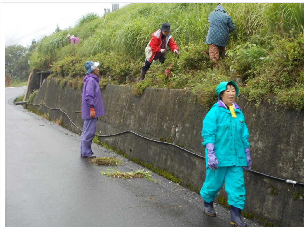
落合アジサイクラブ