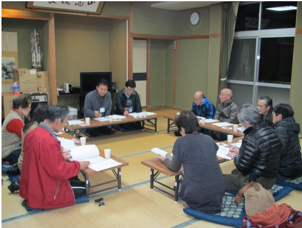
出合地区住民福祉協議会