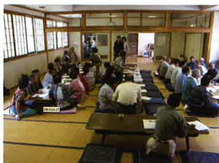
総会開催時の様子 【菅生げんき会(東祖谷)】

社協は、地域福祉を専門分野としています。地域の皆さんが「住み慣れた地域で自分らしく生きていく」ために地域のさまざまな力をつないでいく活動を各事業を通して支援しています。次のページ(図1)のような取り組みの中でみなさんと一緒に「地域を良くする仕組み作り」のための事業を行っています。こうした活動を通じて、誰もが安心して暮らせる心ふれあう町づくりを目指しています。