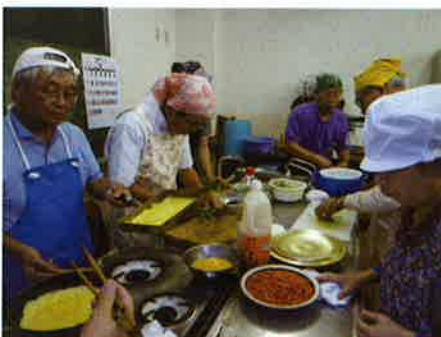
料理教室の様子 【福祉みなわの会(池田)】

少子高齢化や世帯の単身化により社会全体の孤立化や無縁化が広がる中で、「暮らしのセーフティネット」としての「地域のつながりづくり」は、一人ひとりの住民にとっても行政にとっても重要な課題になっています。