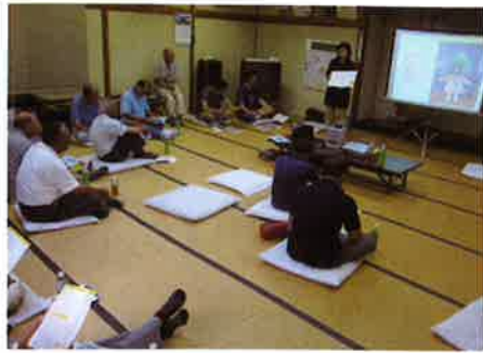
防災教室の様子 【大和地区住協(山城)】

○福祉の意味は、弱者支援ではなく『幸せ』という意味です。地域住民の幸せはみんなで考えることです。