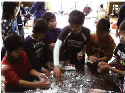
餅つき・クリスマス会の様子 【加茂野宮地区住協(三野)】

○役割だからと言って一人で抱え込まず、地域の皆さんと共有し合い重荷は分担して軽くしましょう。 ○「福祉の種」は皆さんが持っています。 ○大変だなと思うことを誰かがするのではなく、みんなが「できそうだな」と思う取り組みをみんなで始めてみませんか。