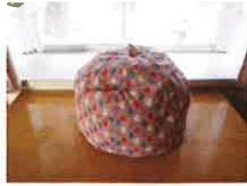
☆煮物、蒸し物、ごはんも鍋帽子で! ☆

この度の研修は、徳島友の会とボランティア初心者向け講習がコラボでお送りします。ボランティア活動している人、関心のある人、みなさん気軽にご参加ください。