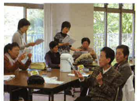
いきいきサロン活動の様子 【善徳地区住協(西祖谷)】