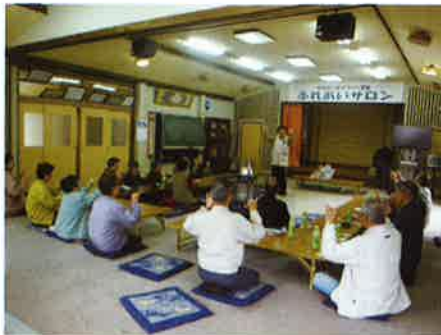
ふれあいサロンの様子 【かいな地区住協(井川)】

うえで、誰もが必要ときに支援の「受け手」になり、それと同時に、各々ができることを実行することで「担い手」になり、互いに支え合うことで安心した地域生活の実現を目指しています。