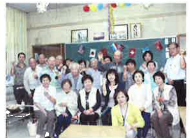
私たち、今日から 認知症サポーターです!

講師のみよし地域包括支援センター看護師から、認知症の症状や接し方などについて講義を受けました。受講者には認知症の人やその家族を見守り、支援するという意思を示す目印のオレンジリングが手渡されました。サポーターのなかから地域のリーダーとして、まちづくりの担い手が育つことが期待されています。