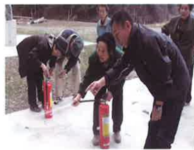
高齢者消火訓練の様子 【樺生地区住協(西祖谷)】