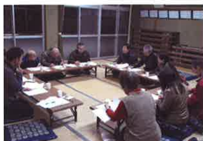
ささえあいネットワーク会議 【出合地区住協(池田)】