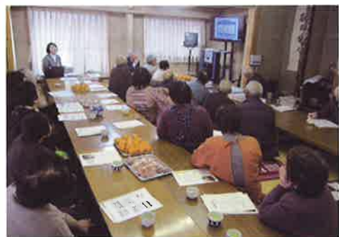
ふれあいいサロン「お楽しみ福祉講座」 【東谷福祉会(三野)】