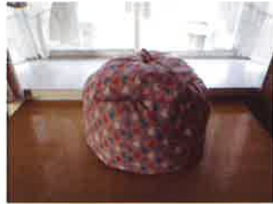
☆煮物、蒸し物、 ごはんも鍋帽子で! ☆

この度の研修は、徳島友の会とボランティア初心者向け講習がコラボでお送りします。ボランティア活動している人、関心のある人、みなさん気軽にご参加ください。