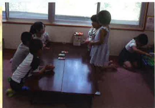
芝生放課後児童クラブ：児童との交流