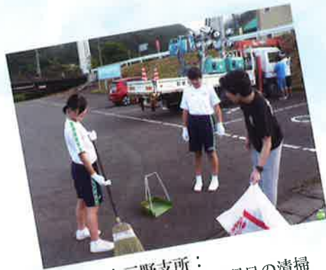
商工会三野支所： 三野フェスタ翌日の清掃

私はお弁当配りのボランティア活動に参加して良かったと思います。それは、この活動はただ単にお弁当を配るのではなく、高齢者の方々が元気に暮らしているかを確認する意味があることがわかったからです。また、一人暮らしをしている方が詐欺や交通事故に遭わないように呼