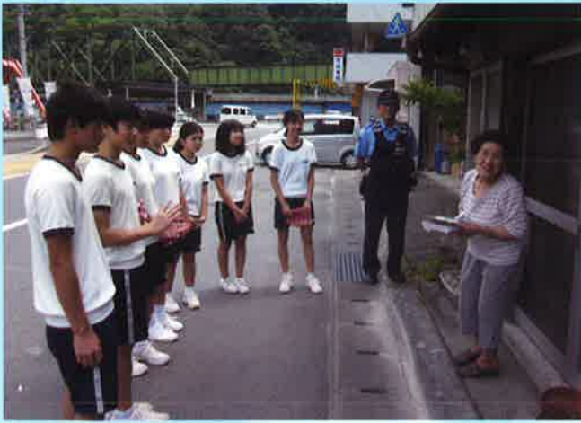
山城やまびこ会：一人暮らし高齢者宅へお弁当の配達

今年も夏休みを利用して、市内の中学生がボランティア活動を体験しました。 この事業は、ボランティア体験活動に自発的に参加し、活動を通じて感じたこと、気づいたこと、学んだことを振り返りながら、地域の中で支え合い「ともに生きる」ことについて考える機会として実施しています。 参加いただいた中学生は46名。多くの人と出逢い、ふれあい、学びの体験をしました。