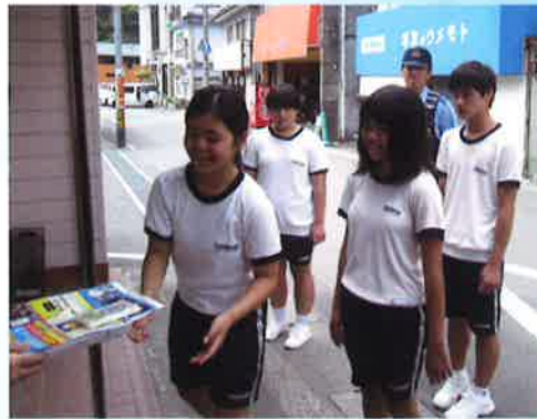
山城やまびこ会：高齢者の安全・安心を確認

今年も夏休みを利用して、市内の中学生がボランティア活動を体験しました。 この事業は、ボランティア体験活動に自発的に参加し、活動を通じて感じたこと、気づいたこと、学んだことを振り返りながら、地域の中で支え合い「ともに生きる」ことについて考える機会として実施しています。 参加いただいた中学生は46名。多くの人と出逢い、ふれあい、学びの体験をしました。