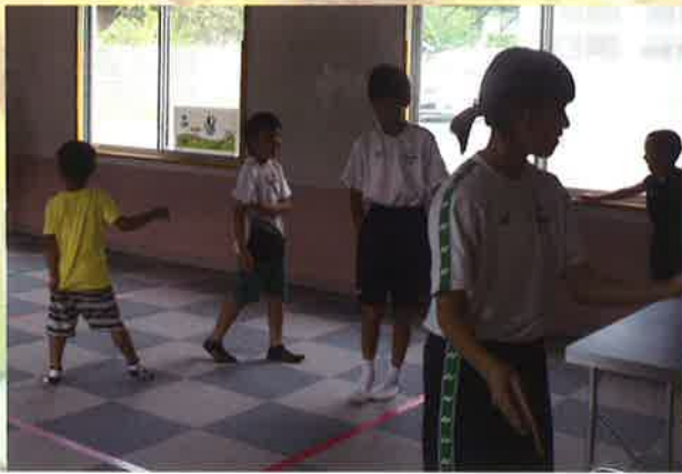
芝生放課後児童クラブ：児童との交流

びかけたりして、安全を見守る意味もありました。一人暮らしの高齢者が増えていく今だからこそ、地域の人たちが助け合う活動がとても大切だと改めて思いました。 お弁当配りをしていて、高齢者の方が「毎年、このお弁当配りを楽しみにしている。子どもたちと会話できるのが嬉しい。」とおっしゃっていました。自分がしたことが、相手の喜びになっているんだとわかり、とても嬉しかったです。