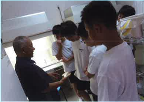
ルネサンスの会：バイオテクノロジー講習