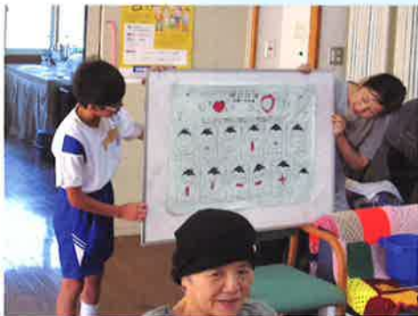
西祖谷デイサービスセンター： レクリエーションの時間