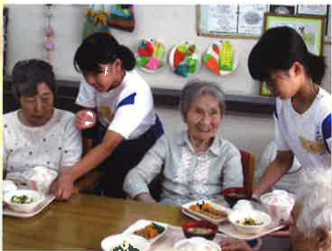
西祖谷デイサービスセンター： 昼食配膳のお手伝い

このほか、三野町遺族会の忠魂碑周辺清掃の参加体験がありました。ご協力いただいた皆さま、大変ありがとうございました。