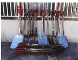
市内関係機関に周知し 集まったスコップ

社協ボランティアセンターでは、『被災地に届けよう！プロジェクト』として、平成30年7月豪雨の被災地へ支援活動を実施しています。このプロジェクトは、池田高校定時制の生徒の皆さんがボランティア活動の一環として作成した「復興応援うちわ」を、平成28年度に熊本地震の被災者へ送ったことから始まり、継続して行っている活動です。