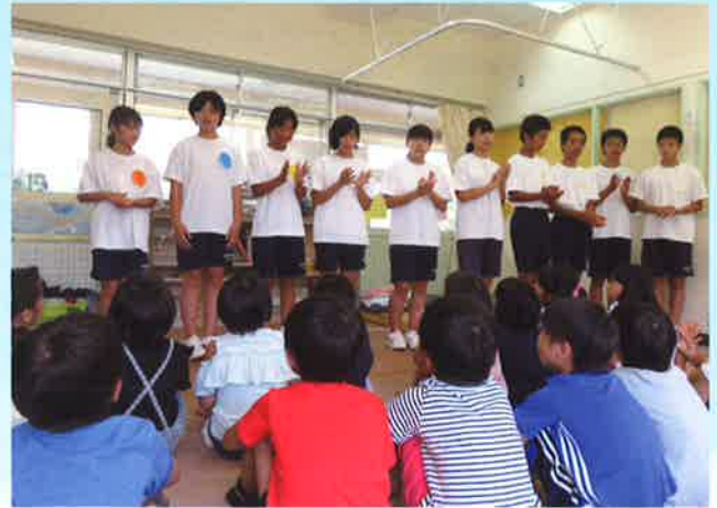
池田・上野ヶ丘放課後児童クラブ：はじめの自己紹介