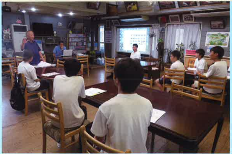
ルネサンスの会：紅白阿讃ソバの栽培講習

僕が参加した放課後児童クラブは昨年も体験したので気楽に参加することができました。すぐに子ども達と仲良くなり、僕の得意な将棋やトランプと一緒に遊ぶことができました。 子ども達といると、僕の方が気持ちが悪くなる、とても楽しかったです。ボランティアと言うより皆と遊びに来た、という感じでした。それがボランティア活動になったので良かったなと思いました。