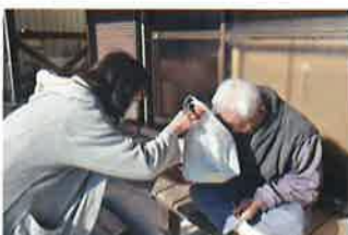
ひとり暮らし高齢者訪問