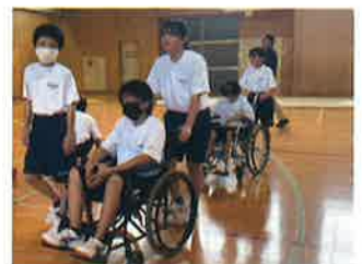
ボランティア協力校助成