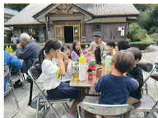
炊き出し・防災訓練