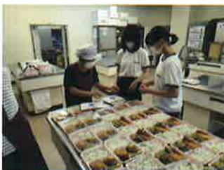
食事サービスボランティア