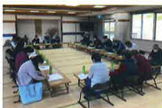
地域福祉活動計画 評価会議