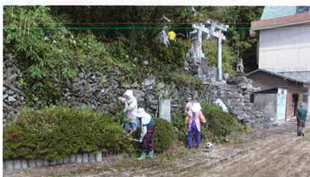
避難所周辺清掃(西祖谷)

誰もがきれいな環境で暮らしたいもの。いつまでも美しい地域であるよう、地域の皆さんが協力して環境美化活動に取り組んでいます。