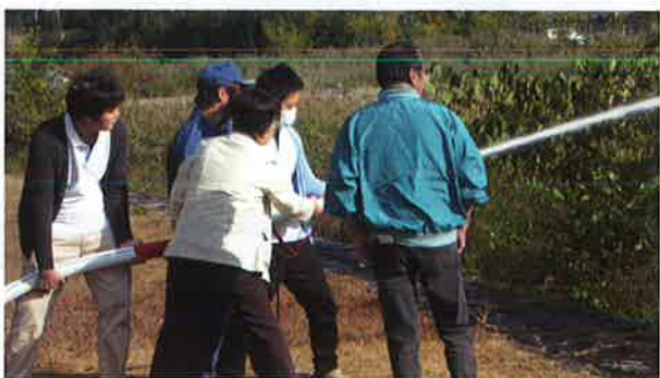
地域住民による放水訓練(三野)

災害時に高齢者・障害者・子どもといった配慮を必要とする方々を支援できるよう、防災訓練にも取り組んでいます。