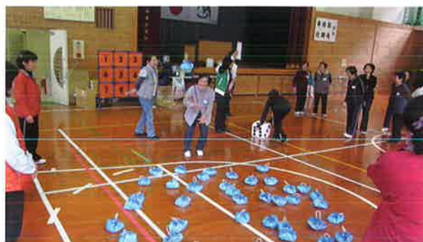
地域でミニ運動会(山城)