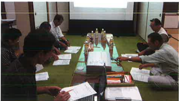
ささえあいネットワーク会議で 要援護者の確認(東祖谷)

住み慣れた地域で安心して暮らし続けるためには、身近な地域の人々との交流や、支えあいが求められています。地区住民福祉協議会では「さりげない見守り」「無理のない交流」を通じて、ひとり暮らし高齢者などの見守り活動を推進しています。