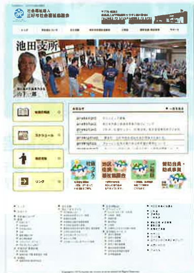
ホームページの開設 http://miyoshicity-shakyo.jp/