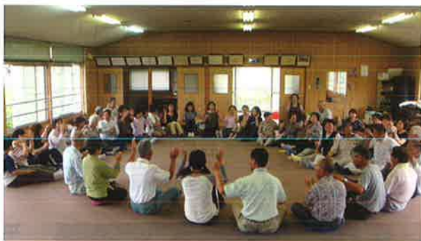
笑顔が集まる楽しいサロン(井川)

高齢者が寝たきりや認知症になる最大の原因は“閉じこもり”といわれています。ふれあいサロンは地域の高齢者が気軽に集い、自由に楽しいひと時を過せる安心・安全の居場所であったり、地域の介護予防の拠点としての機能を持っています。