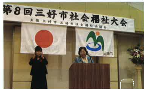
平成25年度 三好市社会福祉大会

本年度も三好市の地域福祉活動推進のために、多くの皆さまのご支援とご協力を宜しくお願い申し上げます。