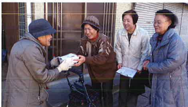
年末見守り訪問(池田)