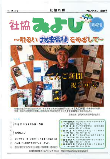
「社協みよし」の発行 (H26.5.10 発行 第42号)