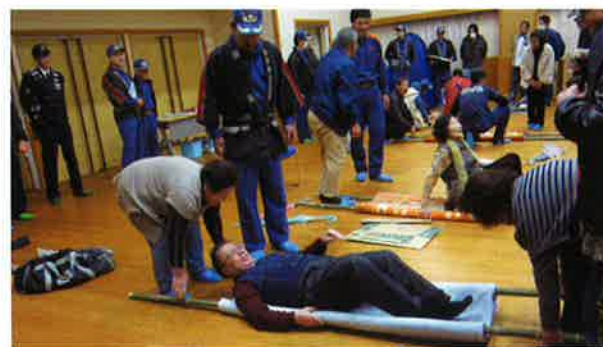
災害時に備えて救助訓練