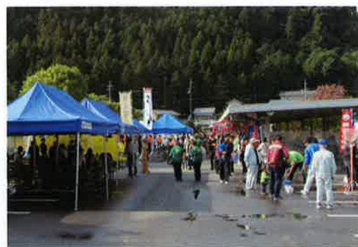
多くの参加者で賑わうふれあい広場