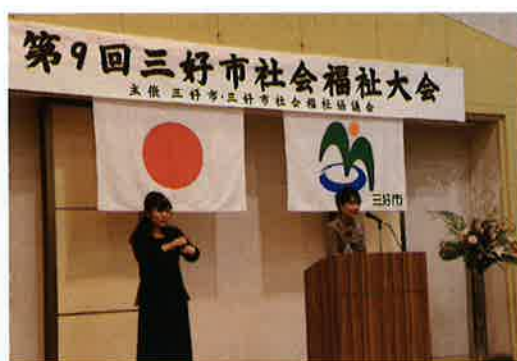
平成26年度三好市社会福祉大会