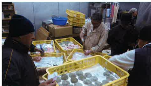
一人ぐらし高齢者世帯への 年末見守り活動

地域に関わる多様な担い手による見守りネットワークづくりを進め、早期発見・問題解決に向けて適切に専門機関等につなぎ支援する体制づくりを推進します。