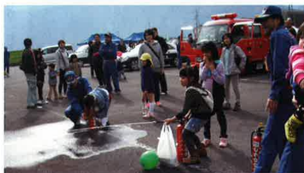
地域住民による消火体験

地域の防災力強化や災害時要援護者の安心を高めるために、日頃から「顔の見える関係」づくりに努め「共に助け合う」体制づくりを推進します。