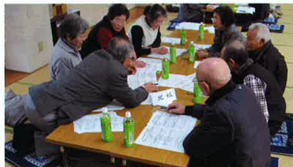
ささえあいネットワーク会議 で要援護者の確認