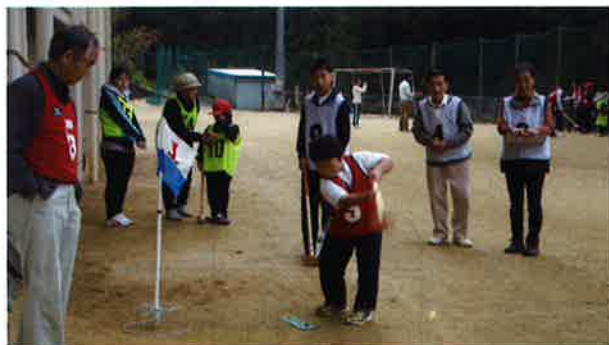
スポーツを通して世代間交流

地域で抱える様々な生活課題を地域住民の参加と協働によって解消し、安心して暮らしていける地域づくりのために、ふれあいの拠点づくりと近隣の助け合い活動を推進します。