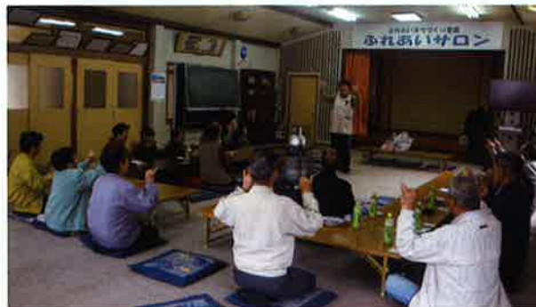
笑顔が集まる楽しいサロン