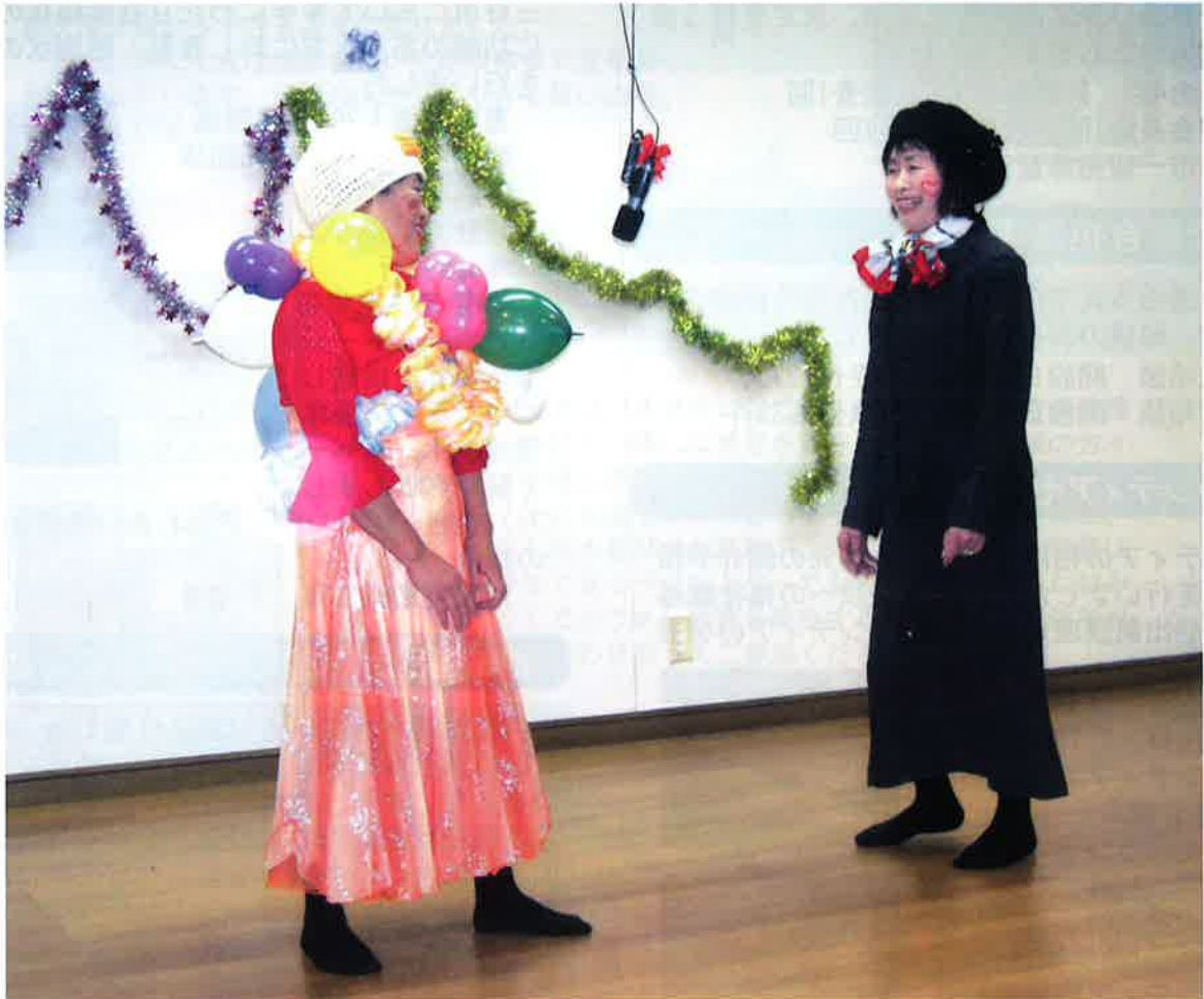
劇団「昔乙女一座」いきいきサロン公演の様子 写真紹介：⑧ページ